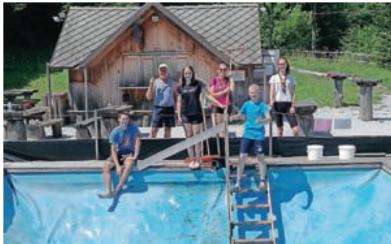
Domačini so sami skrbeli za čistočo in urejenost bazena v Kopačnici.

Ob tem bi se radi zahvalili obiskovalcem, ki so za seboj tudi pospravljali smeti. Sicer pa je tudi dovolj vidno opozorilo, da se vsak kopa na lastno odgovornost. Večina je bila pripravljena v poseben nabiralnik dati tudi kakšen prispevek, da smo lahko