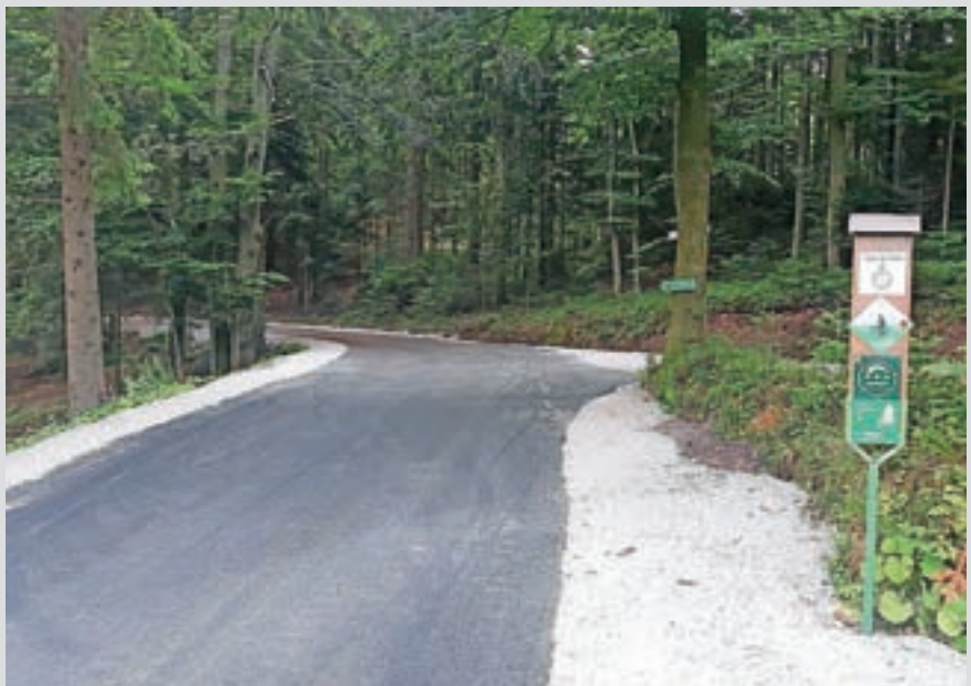
V Golem Vrhu so asfaltirali 250 metrov dolg odsek.

V okviru rednih vsakoletnih asfaltiranj, ki jih opravijo po krajevnih skupnostih, so v občini Gorenja vas - Poljane že končali asfaltiranje v krajevni skupnosti Lučine, kjer so asfaltirali dva odseka, in sicer pri odcepu Podložar in v Golem Vrhu v dolžini 250 metrov. V krajevni skupnosti Poljane so v Malenskem Vrhu asfaltirali križišče in petstometrski odsek ceste proti Ajnžuc, na relaciji Srednja vas-Brda pa so obnovili dva krajša odseka, so razložili na občini. V krajevni skupnosti Sovodenj so asfaltirali 350-metrski odsek ceste Laniše-Lisjak, v Podjelovem Brdu pa sedemdestmetrski odsek ceste Grapa-Kalar-Jeram. Dela nadaljujejo v krajevnih skupnostih Gorenja vas in Trebija, končali pa jih bodo predvidoma do konca oktobra, so še dodali na občini.