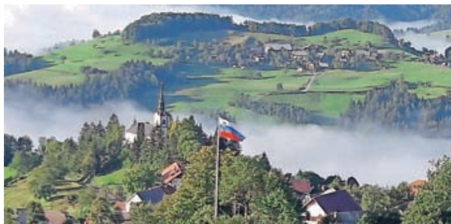
Zastava nad Javorjami

V Gorenji vasi so pol manjšo zastavo na nižjem drogu kot zdajšnje zastave velikanke po krajevnih skupnostih postavili