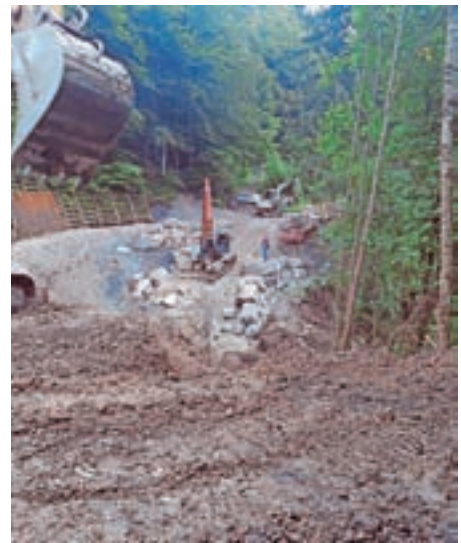
Nadaljuje se obnova ceste Murave–Gorenja Žetina, kjer bodo sanirali še pet cestnih usadov in tri zemeljske plazove.

Pred tem so že končali prvo fazo obnove ceste Murave–Žetina na odseku od Murav do Hleviš, kjer so sanirali štiri obsežne plazove in več udorov ceste, pri čemer so poudarek namenili odvajanju zalednih vod in izgradnji opornih zidov, na novo so izvedli dvoslojno asfaltno prevleko. "Za sanacijo plazov na navedenem odseku ceste smo lani pridobili 768 tisoč evrov nepovratnih sredstev ministrstva za