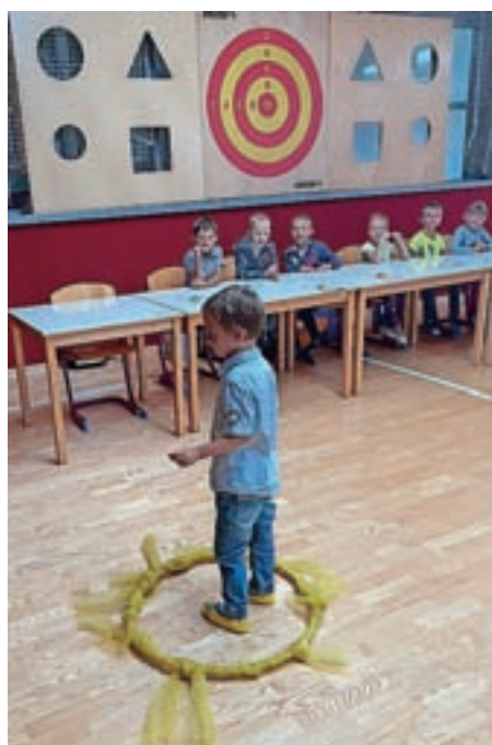
Prvošolci na OŠ Poljane so se predstavili svojim sošolcem.

Pred šolsko stavbo v Poljanah so prvošolci s starši prišli ob 9. uri. Prav tako kot v Javorjah sta jih pozdravila ter obdarila ravnateljica in župan. Otroci so kmalu pomahali staršem ter pogumno in samo-