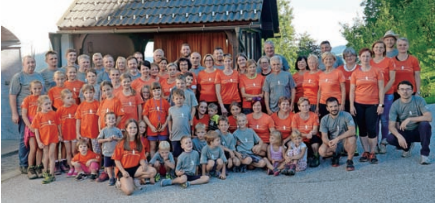
Letošnji prijatelji Slajke pred domačijo pri Slajkarju