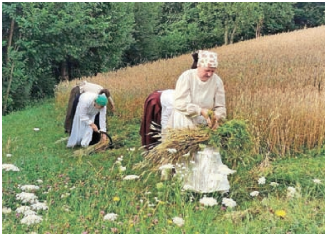
Praznik žetve