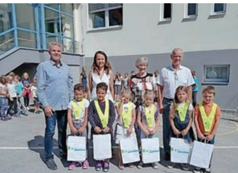
Sprejem prvošolcev na PŠ Sovodenj