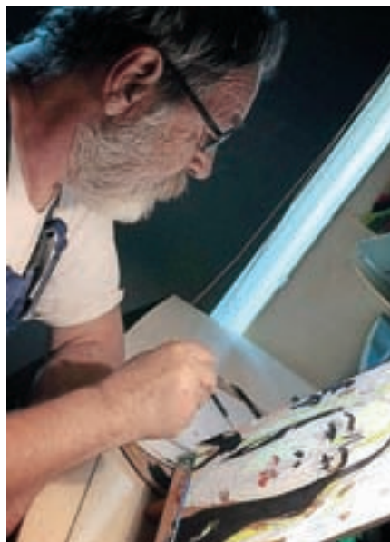
V septembru je na ogled razstava Obrazi knjižnice Zvonka Kerna.

Sredi septembra se je izteklo projekt S knjigo poletja ... doživljam/odkrivam svet . Letošnje leto je bil odziv precej množičnejši kot lani. Zahvaljujemo se