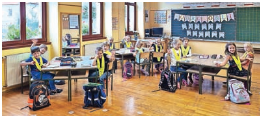
Javorski prvošolci

Piran, ogledali so si akvarij in staro mesto. V zdraviliškem amfiteatru so se udeležili zanimivega koncerta mladih filharmonikov in jih nagradili z velikim aplavzom. Seveda so bili dnevi prežeti s športom. Merili so se v nogometu in odbojki, včasih skupaj z učiteljicami in učitelji. Nekateri so se preizkusili v veslanju v kajaku in ugotovili, da je v vetrovnih razmerah to zelo zahteven šport. Ob večerih je bil čas za družabne igre, pisanje dnevnika in obvezno pravljico pred spanjem. Učne dejavnosti so zaradi lepega vremena lahko potekale v prijetnem obmorskem okolju na prostem. Šolsko leto se je torej za petošolce začelo odlično. Seveda pa upamo, da v nadaljevanju šolanja ne bo zdravstvenih zapletov in da bomo šolsko leto mirno pripeljali do konca.