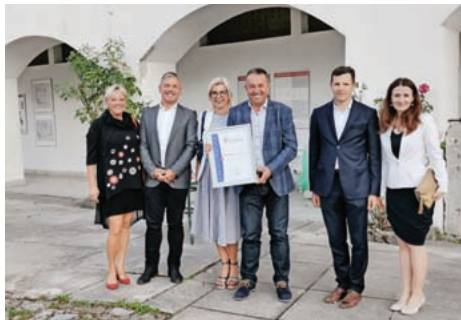
Med nagrajenimi podjetji s tradicijo je podjetje Polycom, kjer dejavnost opravljajo že 35 let.

OOZ Škofja Loka letno podeljuje priznanja tudi tistim obratovalnicam, ki nadaljujejo opravljanje dejavnosti oziroma je ta v družini ali podjetju postala že tradicionalna. Letos je to priznanje prejelo pet članov, med njimi za 35 let podjetje Polycom. Med nagrajenimi podjetji z najdaljšo tradicijo so na prireditvi priznanje podelili Kolarstvu Kuralt iz Škofje Loke, ki obeležuje že 120 let dejavnosti.