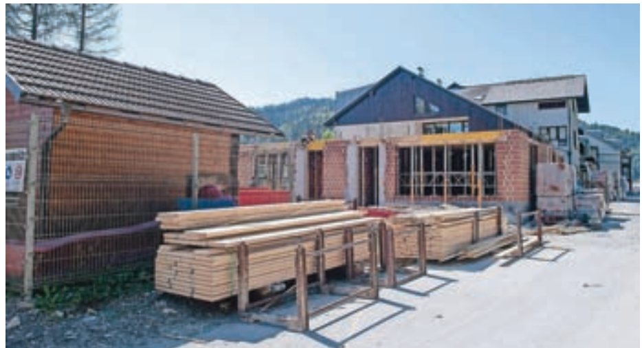
Ob Vrtcu Agata se nadaljuje gradnja prizidka.

Poleti so začeli graditi prizidek k Vrtcu Agata v Poljanah. Projekt dodatnih prostorov vrtca vključuje gradnjo šestih novih igralnic za potrebe vrtca pa tudi dveh nadomestnih učilnic za potrebe šole in ureditev dodatnega otroškega igrišča. V preteklih dneh pa so že končali preureditev in razširitev centralne šolske kuhinje. Razširitev in rekonstrukcija dotrajane šolske kuhinje je potekala od sredine aprila, so pojasnili na občini in dodali, da