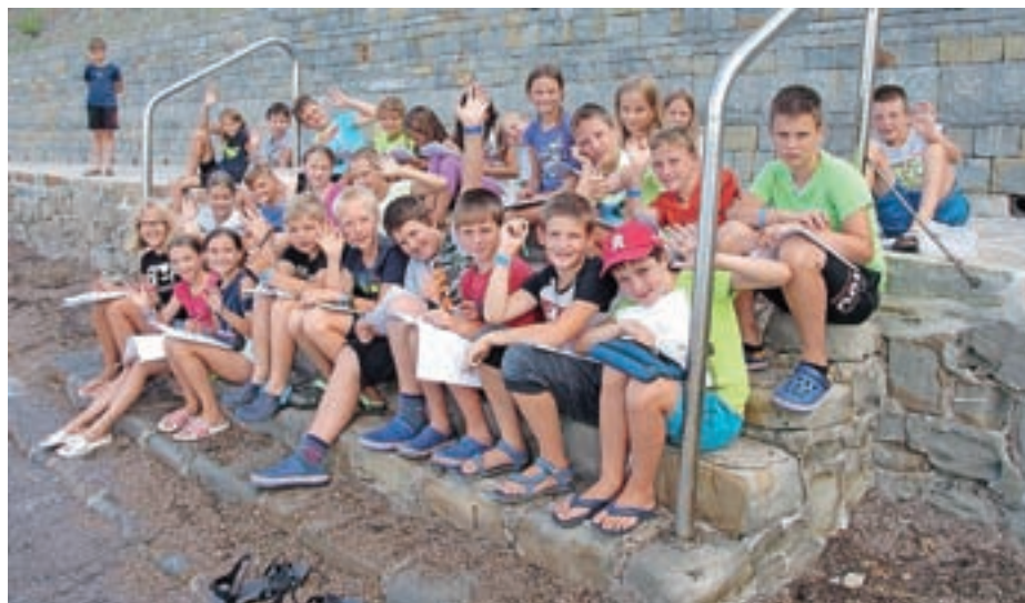
Petošolci so prve dneve pouka preževali v šoli v naravi.

stojno prestopili šolski prag. V učilnici so poslušali pravljico, se spoznavali, na koncu pa so odprli kuverte, v katerih jih je čakala skrivnost. Kakšna le? Verjetno so jo zaupali staršem, ki so ponje prišli ob enajstih.