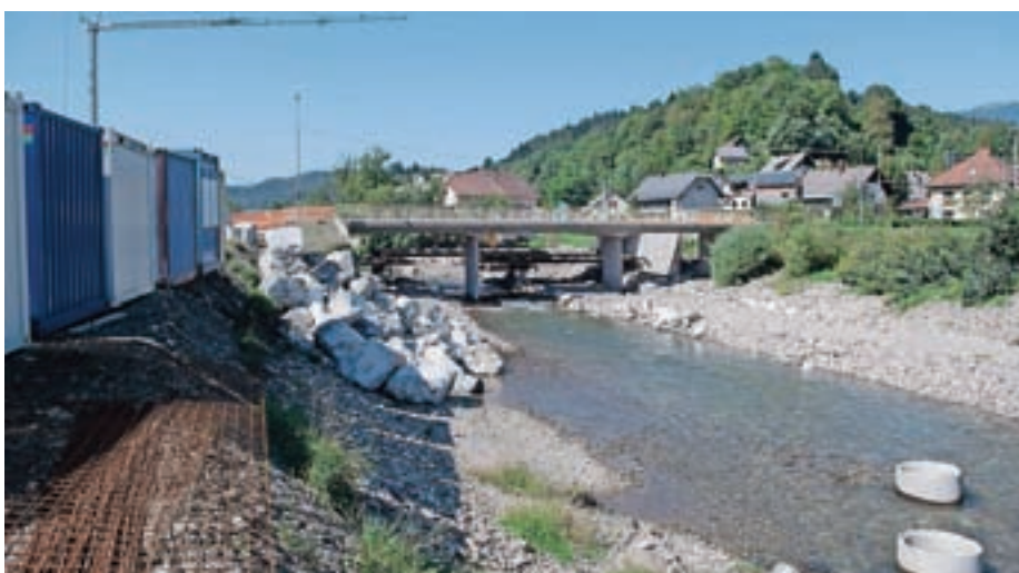
V Poljanah je ta čas obsežno gradbišče, saj so sredi izvajanja del za povečanje poplavne varnosti na tem območju.

Zbirni center Todraž je po novem opremljen tudi z elektronsko cestno tehtnico, katere merilno območje sega od dvajset do petdeset tisoč kilogramov. Uporaba tehtnice je mogoča po predhodnem dogovoru po telefonu (04 518 31 22 ali 04 518 31 00). Zbirni center Todraž obratuje ob ponedeljkih od 9. do 17. ure, ob sredah od 8. do 17. ure in vsako drugo soboto v mesecu od 8. do 12. ure. Ob praznikih je zbirni center zaprt.