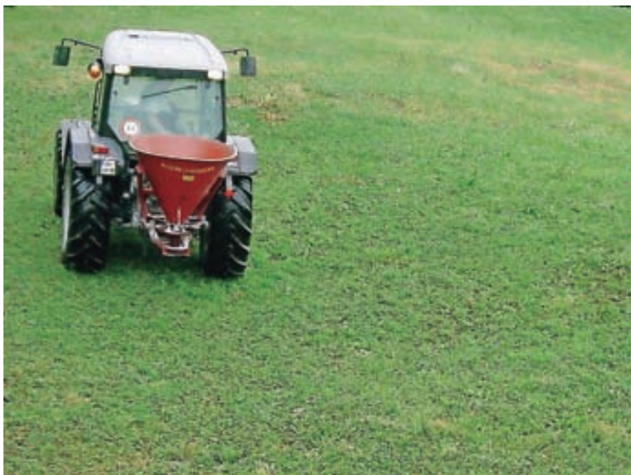
Pravila, kdaj in kako lahko kmetje gnojijo, torej obstajajo, verjetno pa bi jih bilo smiselno prilagoditi razmeram, potrebam, času, krajem.

Nekatere občine, predvsem tiste z intenzivno kmetijsko dejavnostjo, ki kljub vsemu želijo razviti še kakšno drugo dejavnost, npr. turizem, težave rešujejo tako, da subvencionirajo nakup preparatov za zmanjševanje smradu gnojevke in gnojnice. V eni od koroških občin je, denimo, civilna iniciativa konec lanskega leta predlagala sprejem novega občinskega odloka, ki bi vseboval pravila in prepovedi, vezane na gnojenje. Problematike naši državni predpisi ne urejajo v celoti, tudi na ravni Evropske unije na tem področju ni enotne zakonodaje, zato so posamezne države članice problematiko neprijetnih vonjav uredile v okviru nacionalne okoljske zakonodaje.