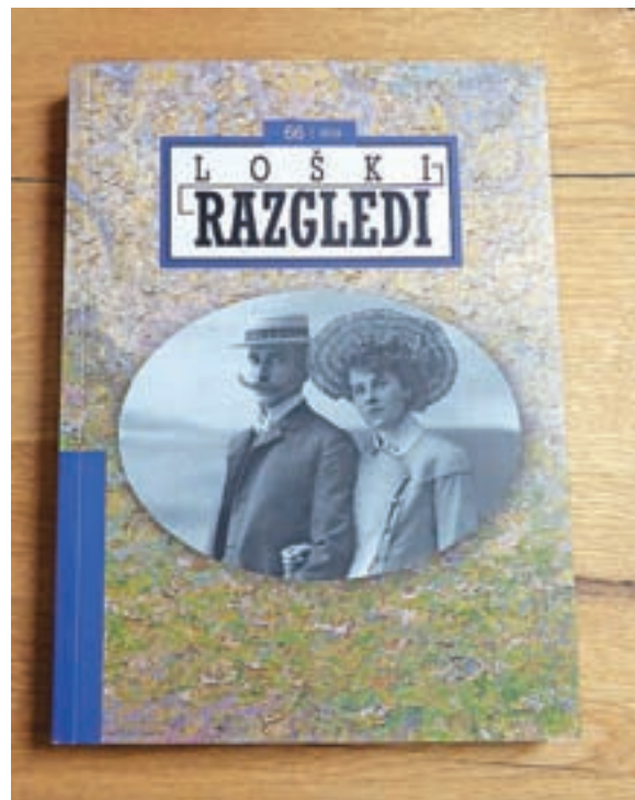
Nova številka Loških razgledov