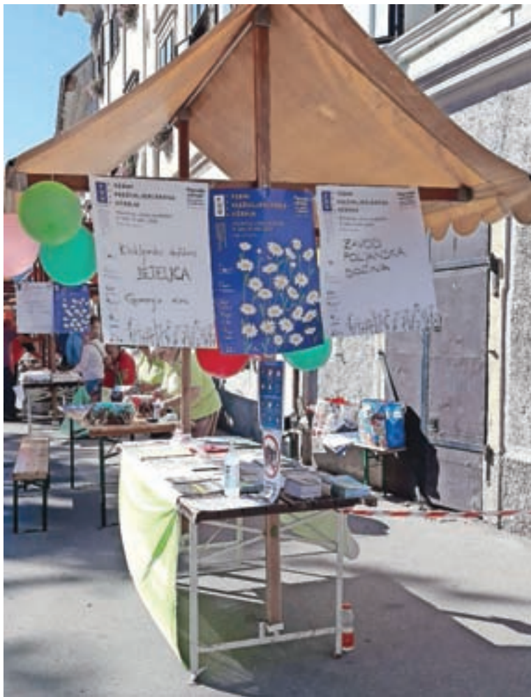
Stojnica Zavoda Poljanska dolina na Tržnici znanja v Škofji Loki

Takšni projekti kot TVU spodbujajo tako usvajanje znanja in veščin kakor tudi njihovo predajanje. Znanje, pa kakršnokoli že, pa je gonilo napredka in nujno za osebno zadovoljstvo ter uspešno delovanje posameznikov in skupnosti.