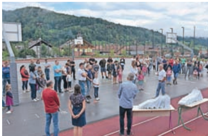
Sprejem prvošolcev na igrišču pred šolo v Gorenji vasi