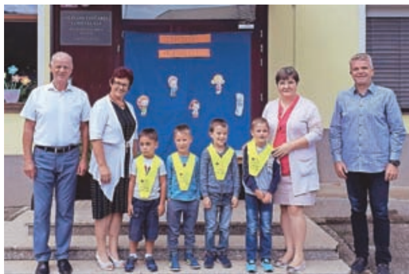
S sprejema prvošolcev na PŠ Lučine