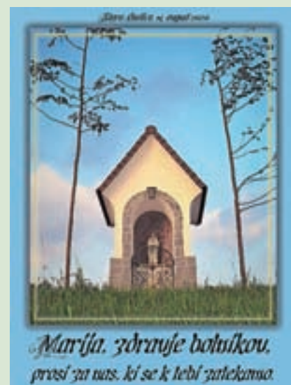
Kapelica v Stari Oselici

Mrovljevem griču in nas pozdravi že, ko se iz gozda pripeljemo po glavni cesti iz Sovodnja proti Ermanovcu, dostopno pa je iz več smeri – z Vrhovcovega griča čez Jamo, od kmetije Sivkar ali pa z vrha Ermanovca. Pri gradnji so poleg domačih požrtvovalno sodelovali tudi okoliški mojstri, ki jim gre še posebna zahvala, zato dodajamo tu misel Antona Aškerca: V delih svojih sam boš živel večno. Lepo je, ko se združijo moči in potem nastane nekaj tako preprostega, a lepega. Tudi njeno sporočilo je jasno: Marija čaka in vabi vse ljudi v stiski, da se ji priporočijo in se izročijo v njeno varstvo, saj je njena ljubezen neusahljiva.