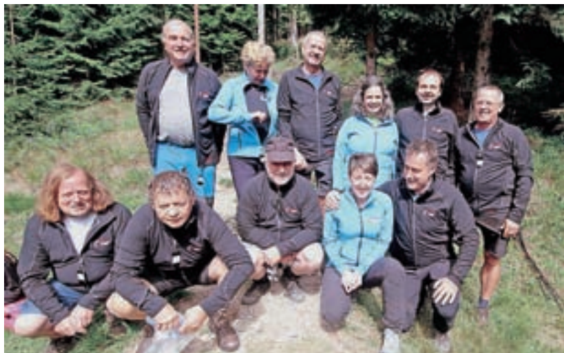
Enajsterica, ki je v sezoni 2019/2020 zbrala vseh 43 vpisov

V društvu so optimistični in napovedujejo, da deseta, jubilejna akcija zagotovo bo, v kakšnem obsegu in pogojih pa je še prezgodaj napovedovati. "Zadovoljen sem, da nam je uspelo zaključiti