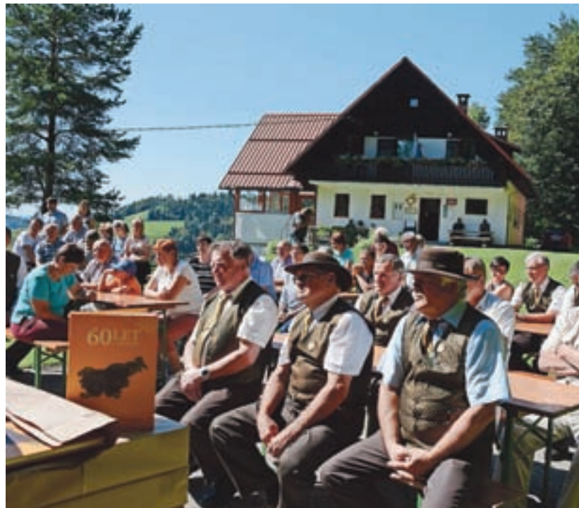
Sovodenjski čebelarji so šestdesetletnico počastili na društvenem srečanju.

"Če v Sloveniji v povprečju na tisoč prebivalcev čebelarijo štirje prebivalci, jih v KS Sovodenj, kjer je od sedemsto do