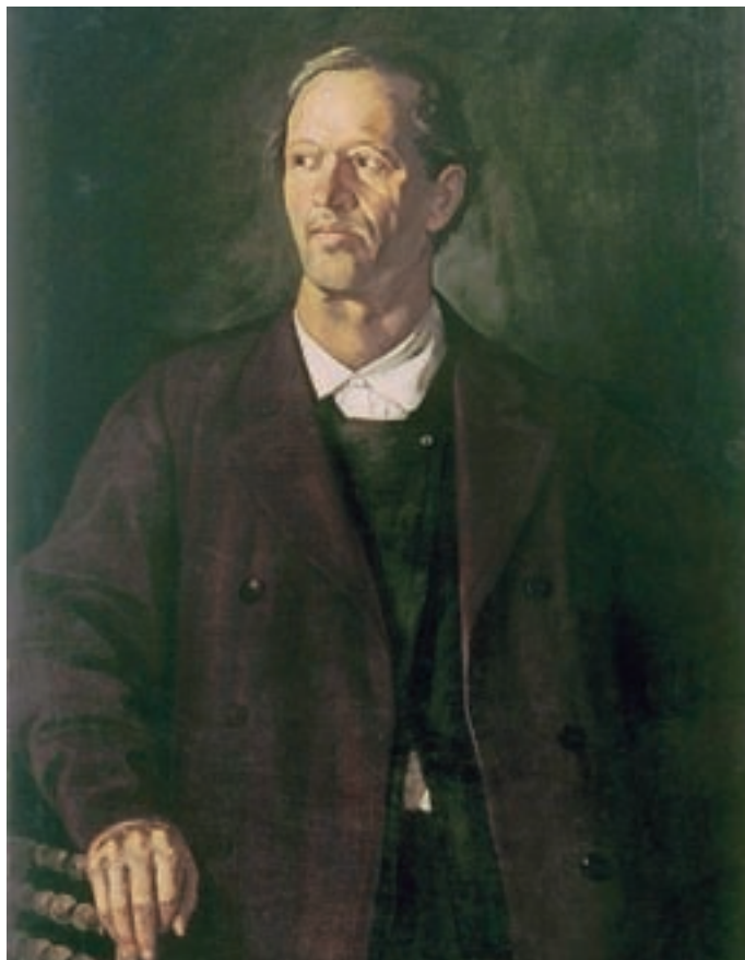
Slika Janeza Šubica Podoba očeta, ki jo hranijo v Narodni galeriji

Podobarstvo je v slovenskih deželah močno zaživelo sredi 19. stoletja, ko so po koncu baroka in zatonu znanih delavnic, kot je bila Layerjeva v Kranju, za opremo podeželskih cerkva po zgledu baročnih začele skrbeti številne družinske podobarske