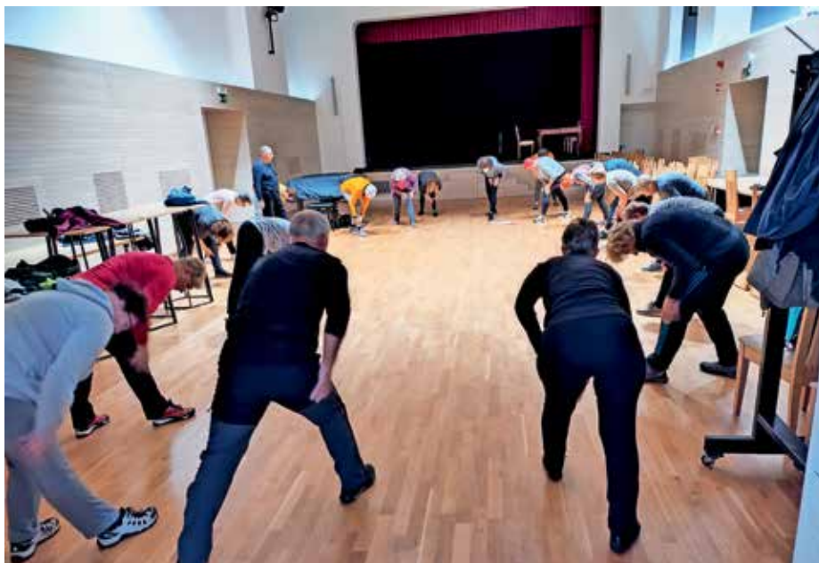
Skupina Sokolc v Gorenji vasi v primeru slabega vremena vadi v dvorani Sokolskega doma.