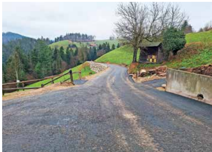
Fino asfaltiranje ceste Sovodenj–Stara Oselica bo počakalo na pomlad.

na območju trase, prav tako so bili vgrajeni poplavno odpornejši prepusti zalednih voda.« Na tem delu ceste so sanirali tri obsežne plazove v skupni dolžini okrog 150 metrov in višine od štiri do šest metrov. V decembru so izvedli asfaltiranje ceste z grobim asfaltom, vremenske razmere pa niso dopuščale, da bi izvedli še fino asfaltiranje, zato so to prestavili na pomlad, je še pojasnil Čadež. Tudi omenjena obnova je po njegovih besedah pomembno prispevala k ponovni ureditvi pomembne povezave z občino Cerkno.