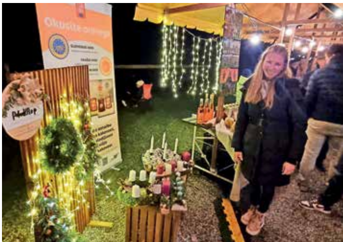
Adventni sejem na posestvu Dvorca Visoko

Na prvo adventno nedeljo so na posestvu Dvorca Visoko pripravili adventni sejem, v okviru katerega sta potekali tudi dve praznični delavnici, prisluhniti je bilo mogoče še predavanju o potici.