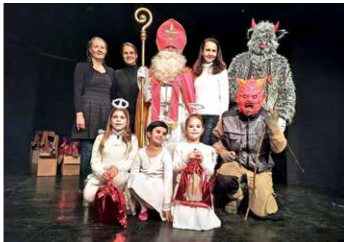
Miklavž na Sovodnju

Otroci od enega leta starosti pa do petega razreda iz KS Sovodenj oziroma fare Nova Oselica so bili v kulturni dvorani na Sovodnju deležni vznemirljivega dogodka kot že vrsto