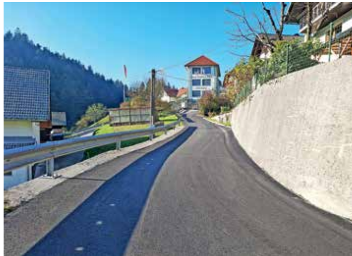
Sredi novembra so končali obnovo lokalne ceste Sovodenj–Nova Oselica–Cerkljanski Vrh.

Predvidoma do konca aprila prihodnje leto pa naj bi končali še sanacijo lokalne ceste Sovodenj–Stara Oselica, na kateri dela potekajo od letošnjega aprila. Obnova bo po besedah Gašperja Čadeža vredna 690 tisoč evrov, od tega bodo samo za gradnjo podpornih zidov odšteli več kot tristo tisoč evrov. »Sanacija kilometer dolgega odseka obsega stabilizacijo cestnega ustroja in vzpostavitev ponovne, poplavno varnejše prevoznosti cestišča. Sanirane so bile vse brežine in mostovi