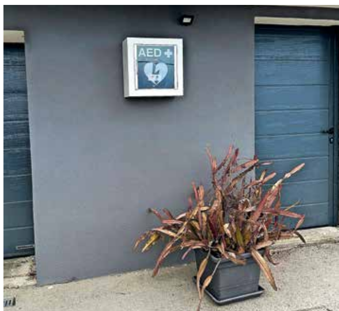
Avtomatski zunanji defibrilator na Gorenjem Brdu

pa so prikazali prisrčen program. Izkazali so se tako v plesu in petju kot recitacijah. Obiskovalci prireditve so obiskali še bazar, na katerem so bili na voljo izdelki vrtčevskih in šolskih otrok.