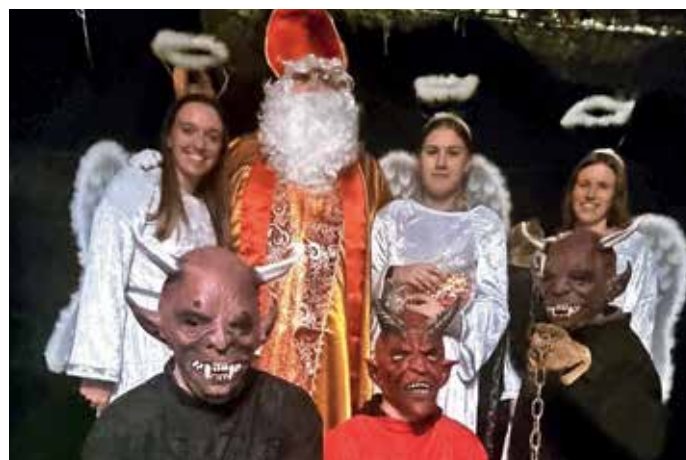
Otroke iz Leskvice in okoliških vasi je Miklavž obiskal na domovih.

let doslej. Učenci dramske in Orffove skupine Podružnične šole Sovodenj so zaigrali posebno priredbo koroške pravljice Mojca Pokrajculja. Plesalcem iz vrtca in šole pa je glasba narokovala plesne gibe, tudi v mraku in z lučkami na sebi. Mladi gledalci v dvorani so najbolj nestrno pričakovali Miklavža. Prišel je v spremstvu dveh parkeljnov, v vlogi angelčkov so se jim pridružile še tri učenke. Dobri mož je med otroke razdelil nekaj čez devetdeset daril, prijazne misli in želje. Svojo pot v naši občini je Miklavž zaključil v Zadržnem domu na Hotavljah, kjer je med otroke s Hotavelj, Srednjega Brda, Hlavčih Njiv, iz Volake, Čabrač, Suše in z Jelovice razdelil 99 daril.