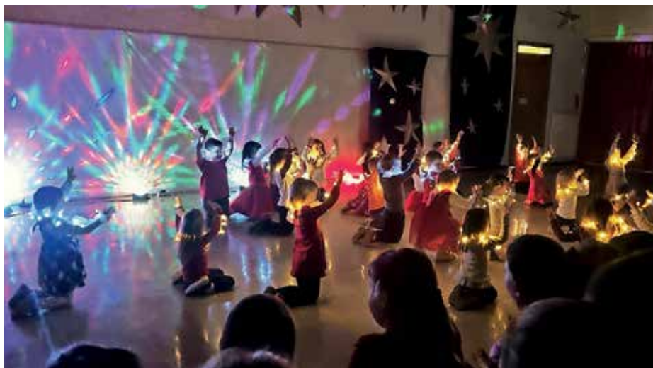
Najmlajši plesalci so navdušili s plesom v temi.

Plesalke in plesalci pod vodstvom Petre Slabe so tudi letos zaplesali v prazničen december.