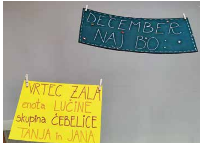
Otroci so v knjižnici pripravili razstavo, s katero sporočajo, kakšen naj bo december in vse leto.

otrokom in mladini. Urh je izreden govornik in predavanje bo zanimivo tudi za otoke. Povabljeni, prisluhnite jima.