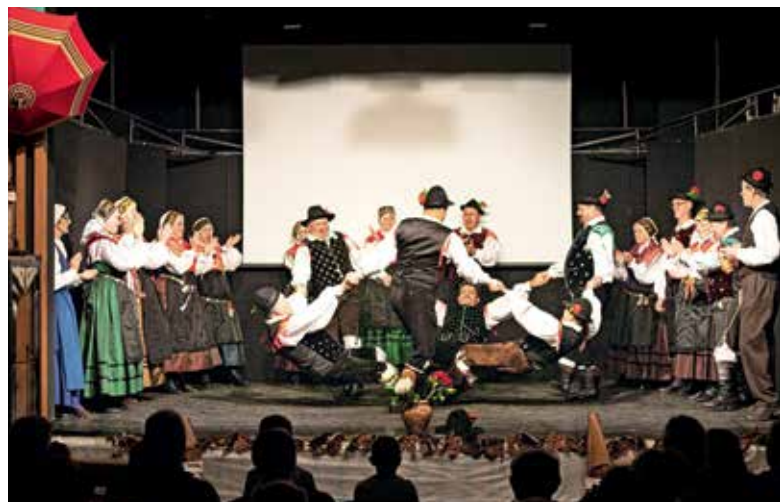
Plesna zvezda

ši pari po stažu v skupini so zaplesali prvi venček, ki so se ga naučili pred skoraj 43 leti in ga kasneje niso spreminjali. Občinstvo je spet navdušil ples z likom zvezde, ki so jo oblikovali močni moški, pa tudi gimnastične vragolije godca med plesalci. Večina folklornih parov se je vrtela ob spletu plesov novejšega venčka z naslovom Ples na podu – ali kot ga imenujejo sami: Kar po rit jo udar. Za to odsko postavitev, glasbeno priredbo, kostume, tehniko plesalcev, izvedbo nastopa ter igro jim je strokovna komisija na regijskem nivoju prisodila srebrno priznanje. Folkloristi se dobro znajdejo tudi v igranju skečev, četudi brez