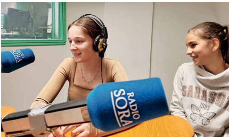
V studiu Radia Sora

Vse to in še več so se naučili šolski novinarji. Med drugim so se v program oglašili tudi v živo in se preizkusili v studiu. Spoznali so, da so lokalne radijske postaje pomemben del radijske mreže, saj v programu še posebej poudarjajo dogodke v lokalnem in regionalnem okolju.