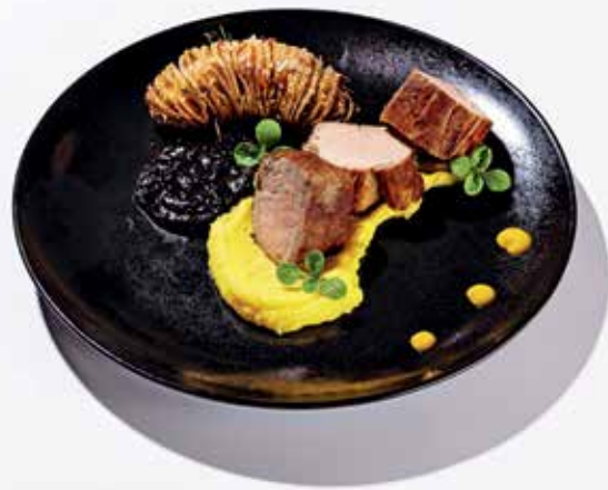
Festivalski krožnik taverne Petra

Zavedajo se sodobnih trendov in pomena zdravega prehranjevanja, ki temelji na sezonskih jedeh in živilih lokalnega izvora. S povezovanjem dobaviteljev lokalnih živil in gostinskih ponudnikov se prenavlja obstoječa kulinarična ponudba. Ta temelji na uporabi lokalnih surovin in pripravi hišnih specialitet, postreženih na sodoben način. Pri projektu sodeluje tudi več kot deset ponudnikov lokalnih živil iz naše občine. Cena menija je enotna: 28 evrov. Predhodne najave na dogodek so zaželeno. Tako v Gostilni Lipan kot Taverni Petra so za festival pripravili popolnoma nove krožnike, na katerih so lokalne sestavine in zelenjava z domače-