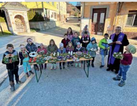
Otroci so izdelali adventne venčke.

Dan pred prvo adventno nedeljo je v Javorjah potekala delavnica za otroke, kjer so izdelovali adventne venčke. Udeležilo se je lepo število otrok, in preden so venčke odnesli domov, je župnik podaril še božji blagoslov, ki naj nas vse spremlja v tem adventnem času. Hvala vsem za udeležbo in pomoč pri organizaciji.