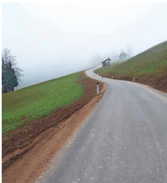
Na cesti od Četene Ravni do Zaprevala se končuje sanacija plazov.