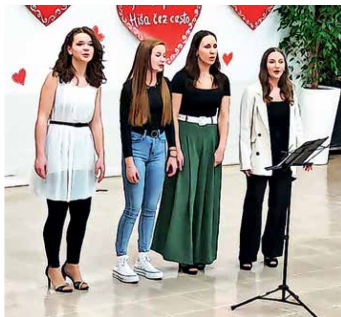
Polanska dekleta