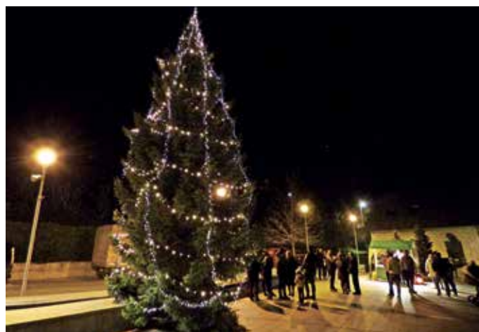
Letošnja smreka na Trgu Ivana Regna se odlikuje po svoji lepoti.