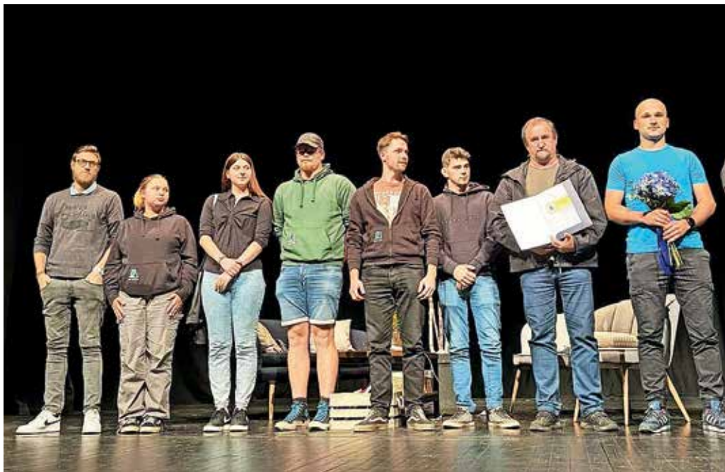
Sovodenjski igralci na podelitvi priznanja

Ko so igralci izbrani, režiserja določita vloge. Na začetnih vajah se razdelijo v tri skupine, kjer režiserja že vnaprej določita, katere vloge so skupaj, in nakažeta, kakšen naj bo namen posameznega skeča. Na koncu teh vaj skeče zaigrajo pred drugimi in postopoma nastaja zgodba, ki lahko zaide tudi v drugo smer. »Ko je 'okostje' predstave izdelano, sledi ponavljanje, dodajanje učinkov, utrjevanje ... Delamo po principu 'commedia dell'arte' (komedija v improviziranem načinu), kar pomeni, da naše komedije nimajo točno napisanega teksta, imajo pa trdno določen zaris dogajanja, ki ga je treba upoštevati, drugje je dovoljena improvizacija. Prednost je v tem, da igralci aktivno sodelujejo že pri ustvarjanju zgodbe in se tako hitreje najdejo v vlogi,