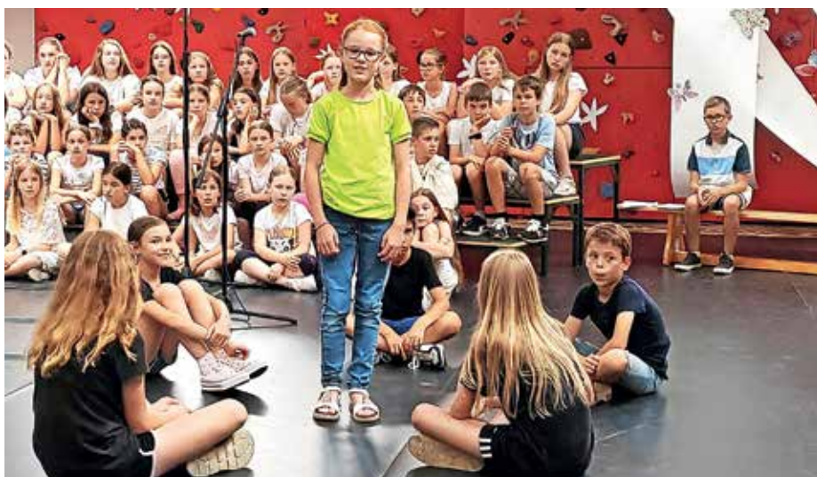
Zaključna prireditev

Učenke in učenci 9. razreda so že 11. junija pripravili res lepo valetu, takoj naslednji dan pa odšli na Roglo, kjer so skupaj preživeli še zadnje osnovnošolske dni. Po vrnitvi v Poljane so prejeli spriče-