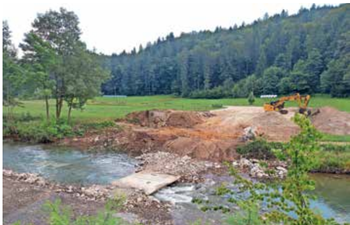
Na Hotavljah se je začela gradnja novega mostu čez Poljansko Soro.

posledično ima publika vsako leto visoka pričakovanja. Poleg predstave Dizldorf so se publiki predstavili še s predstavo Vêrbšna, ki je prav tako avtorska in si jo je ogledalo več kot 1100 ljudi. »V kratkem bomo preverili razpoložljivost igralcev, tehničnih sodelavcev in režiserjev, ki bodo na voljo naslednjo sezono, in se na osnovi tega odločili, ali bomo delali eno ali dve predstavi. Vse tiste, ki jim tovrstno ustvarjanje ni tuje, vabimo, da se pridružijo naši igralski družini.«