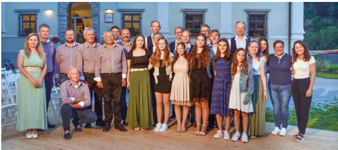
Ustvarjalci letošnjega Pevskega večera

Zala ter skupina Šefle, ki so se jim v drugem delu priključile še mlade pevke Tajda, Anja in Katja. Tako kot lani je tudi letos k sproščenemu in prijetnemu glasbenemu dogodku prispevalo tudi lepo vreme, ki je poskrbelo, da so obiskovalci resnično uživali v toplém poletnem ambientu visoškega dvorca. Ob spremni besedi Lucije Kavčič so se med glasbo in petjem neopazno prižgale lučke na visoškem vrtu, ki so poskrbele, da se je prijetno vzdušje nadaljevalo tudi še po koncertu pozno v noč.