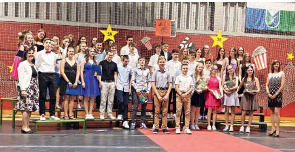
Srečno, devetošolci