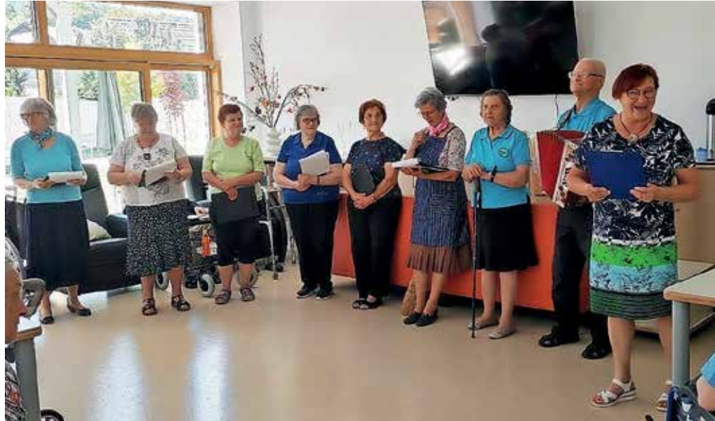
V Hiši generacij je živahno tudi poleti.

Povpraševanje za bivanje v poletnih mesecih se začne že v začetku leta. Rezervacije za junij, julij in avgust so zapolnjene zgodaj spomladi. Interes za kratkotrajne