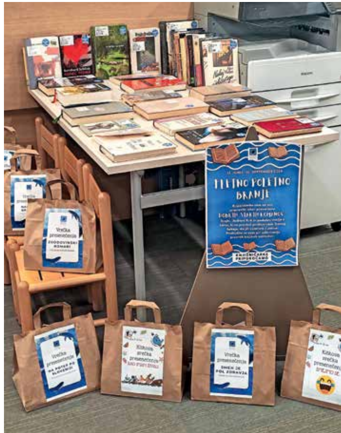
Fletno poletno branje

Celo poletje je na ogled razstava Naših 20 let Klekljarskega društva Deteljica Gorenja vas. Tokratna razstava ponuja izbor del njihovih članic, ki so društvu zveste že dolgo let. Kot vedno je