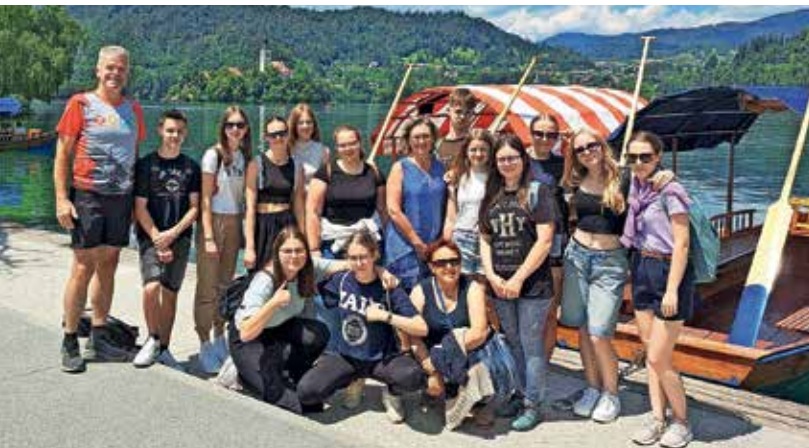
Najuspešnejše devetošolce je župan Milan Čadež za nagrado peljal na izlet na Bled.

vodnih igrah. Vsak dan je poskrbljeno tudi za prehrano, in sicer otrokom nudijo tri obroke: zajtrk, kosilo in popoldansko malico.