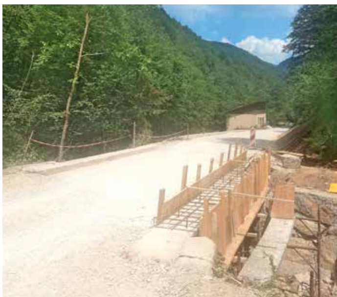
Na lokalni cesti Kopačnica–Podpleče poteka intenzivna sanacija.

obsežno dodatno meteorno kanalizacijo za odvod vode s plazljivega območja. V času sanacije plazu bo zaradi varnosti igrišče deloma zaprto. Dela bodo predvidoma končali do konca poletnih počitnic, tako da bo pred vrnitvijo učencev v šolske klopi igrišče ponovno varno za uporabo