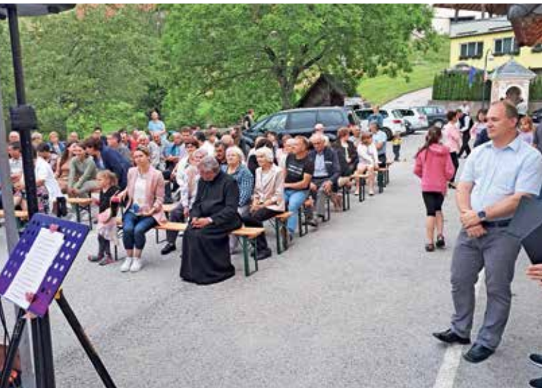
Prireditev ob dnevu državnosti v Javorjah

proslavi,« je bil po dogodku zadovoljen predsednik KS Javorje Peter Peternel.