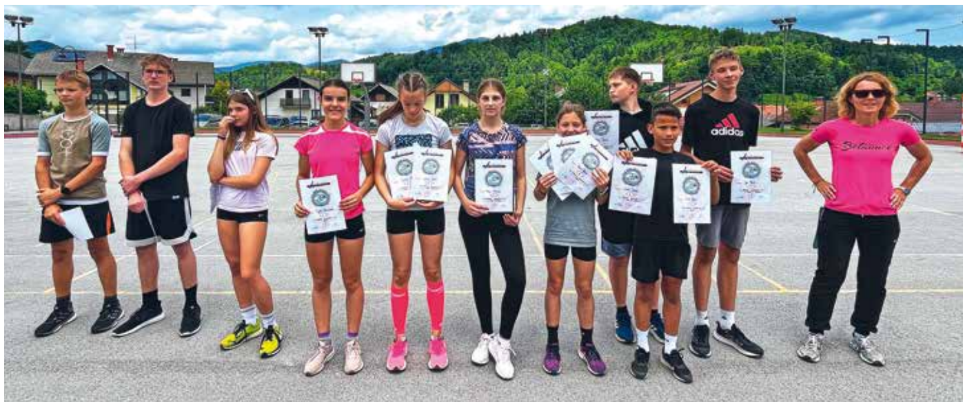
Najboljši atleti iz 7. in 8. razreda na šolskem prvenstvu

V Podblegaških novicah smo redno poročali o najpomembnejših priznanjih iz znanja. Ob koncu leta so učenci prejeli sedem zlatih in 14 srebrnih priznanj. Več o rezultatih z različnih področij si lahko ogledate na šolski spletni strani. Na pragu poletja poteka tudi teden vseživljenjskega učenja. Na šoli so izvedli več delavnic: tibetanske vaje pomlajevanja, kuharsko delavnico za drobnjakove štruklje, gasilstvo, spoznavanje zelišč in pripravkov iz njih, na Paradi učenja v Škofji Loki pa so predstavili »fotopotepe«. Poletne počitnice so tu! Naj vseživljenjsko učenje poteka tudi v šole in službe prostih dnevih. Samo učni predmeti naj bodo izbirni in vsakemu prilagojeni po njegovih željah in interesih.