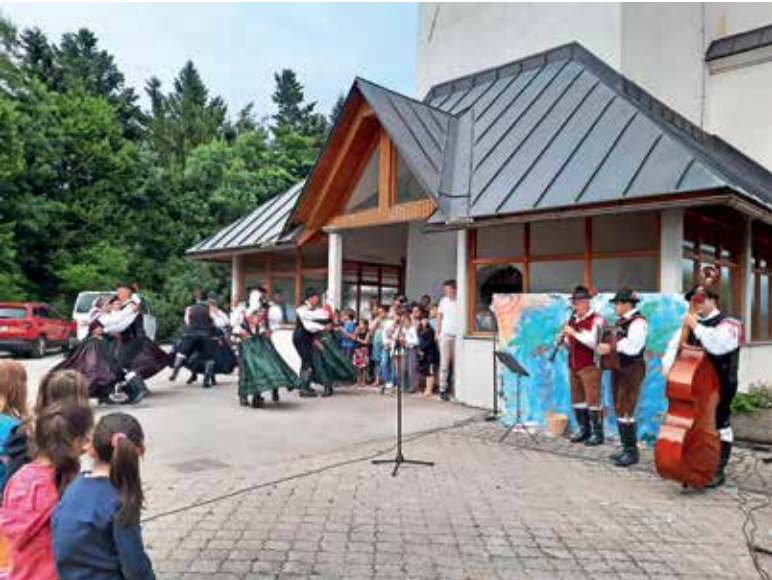
Nastop FS TD Sovodenj v Novi Oselici