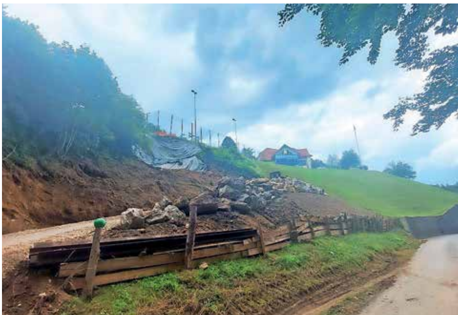
Sanacija plazu pod športnim igriščem pri podružnični šoli in vrtcu na Sovodnju

Za sanacijo nastale škode so pridobili projekt sanacije z geološkim elaboratom, ki predvideva utrditev temeljnih tal na dnu plazu in izgradnjo opore v brežini, da bi preprečili ponovno tveganje plazenja.